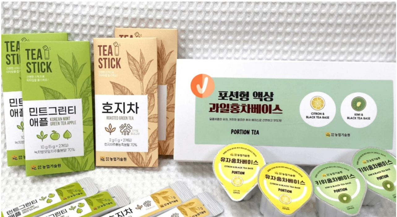
건강 기능성 분말·액상 형태 4종...다류 소비층 확산 기대