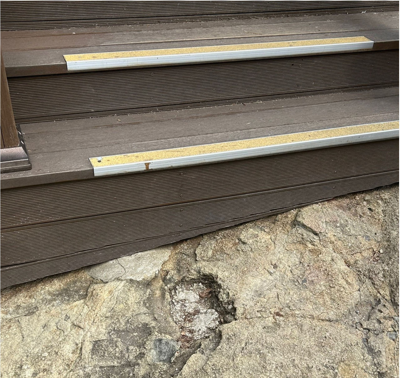
( http://www.yeosu.go.kr )