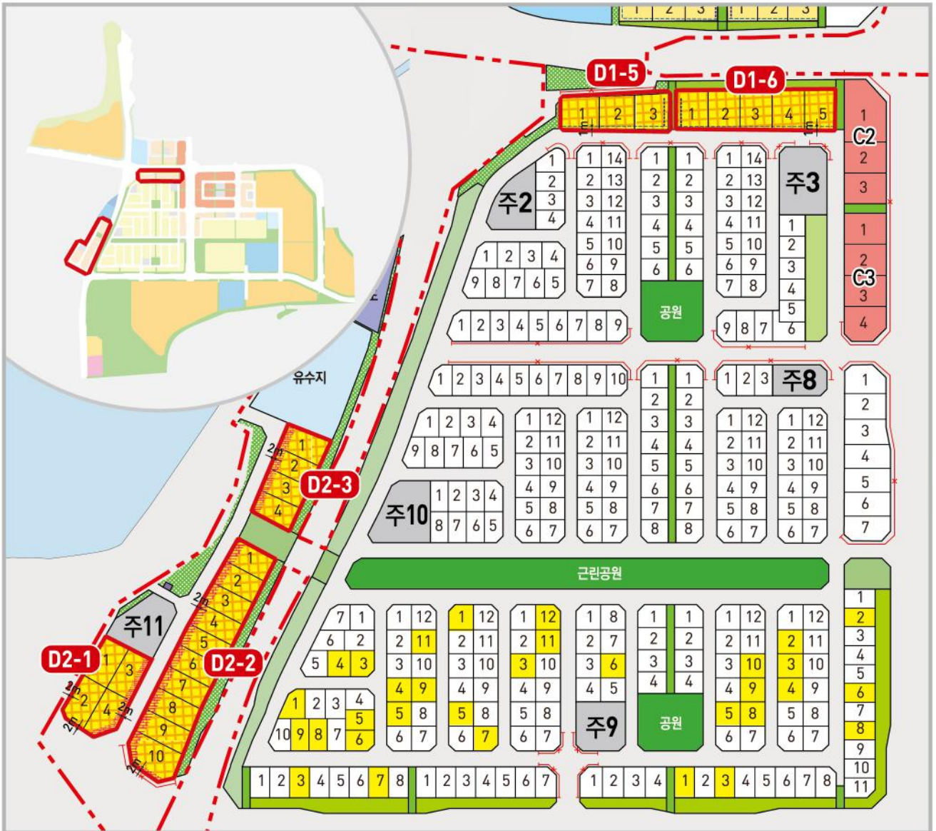
----- 1층벽면지정선 ..... 건축한계선 -X-X- 차량출입불허구간 - - - - 도시개발사업구역계 - - - - 획지경계선 D1/D2 가구번호 [ ] 가로특화형공지