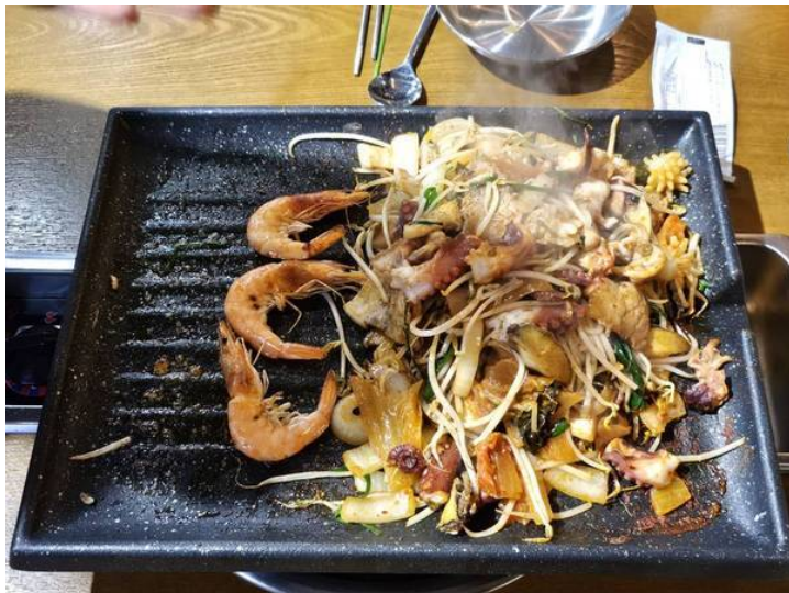
여수관광문화( http://tour.yeosu.go.kr )