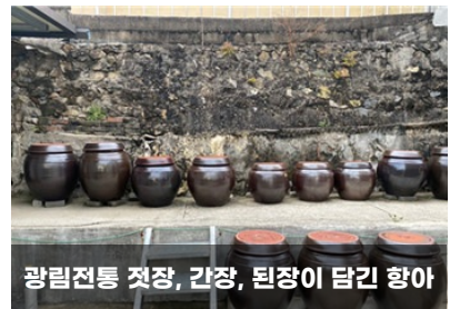
광림전통 젓장, 간장, 된장이 담긴 항아