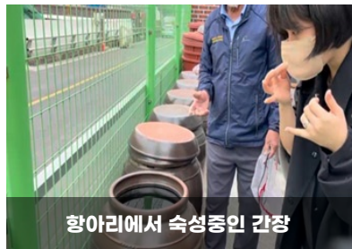
항아리에서 숙성중인 간장