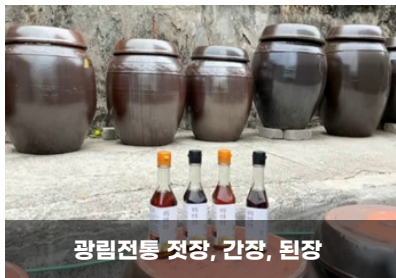
광림전통 젓장, 간장, 된장