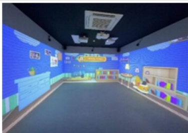
인터랙티브존 이용연령 : 36개월 이상~미취학