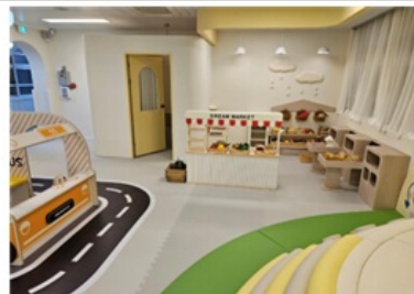
조물조물놀이존 이용연령 : 12개월~36개월 미만