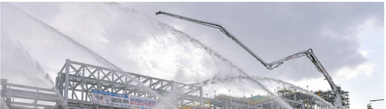
( http://www.yeosu.go.kr )