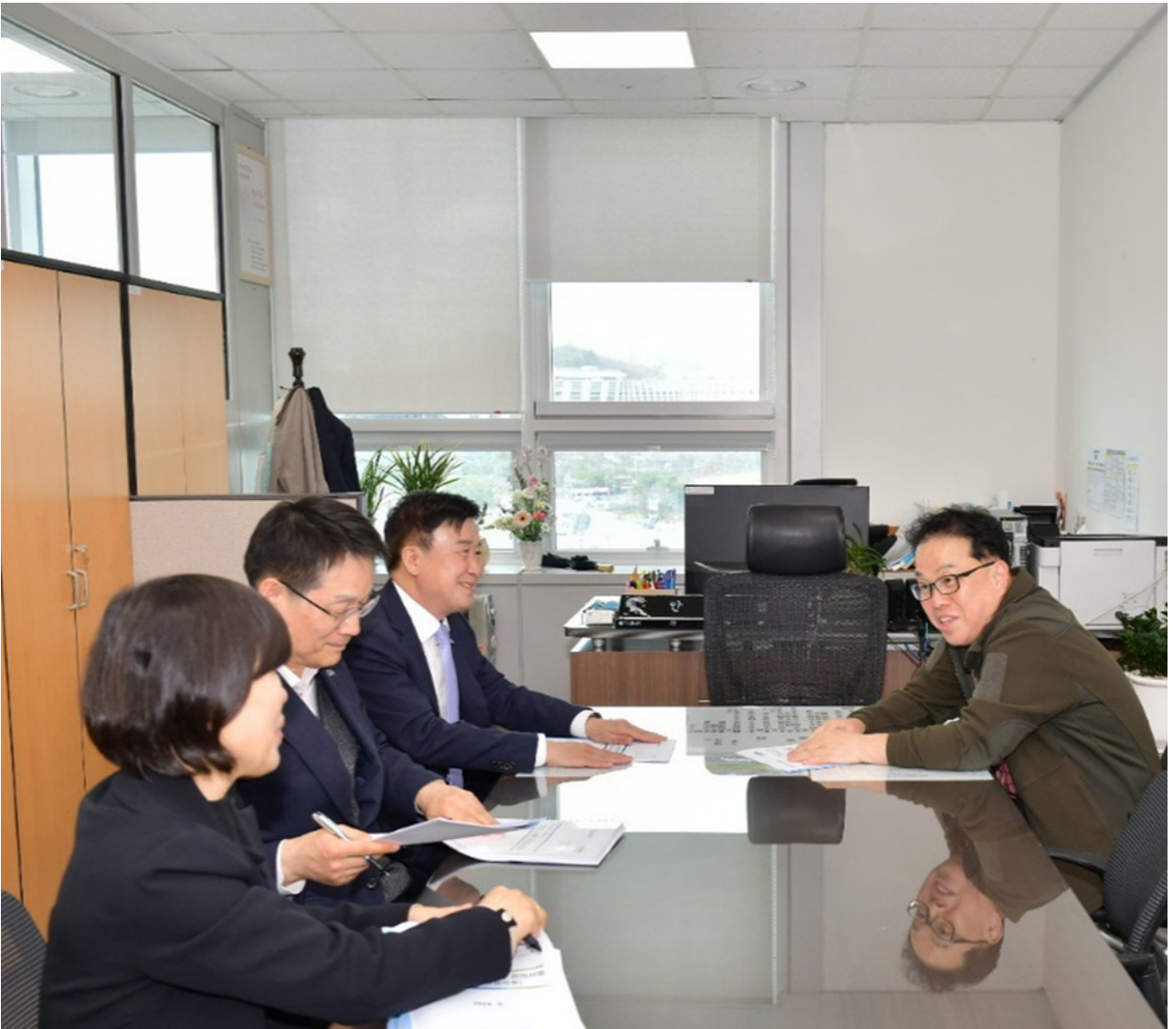
( http://www.yeosu.go.kr )