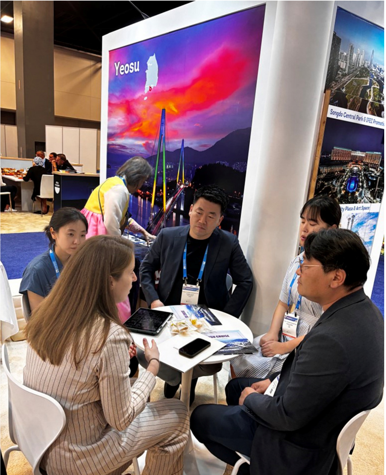
( http://www.yeosu.go.kr )