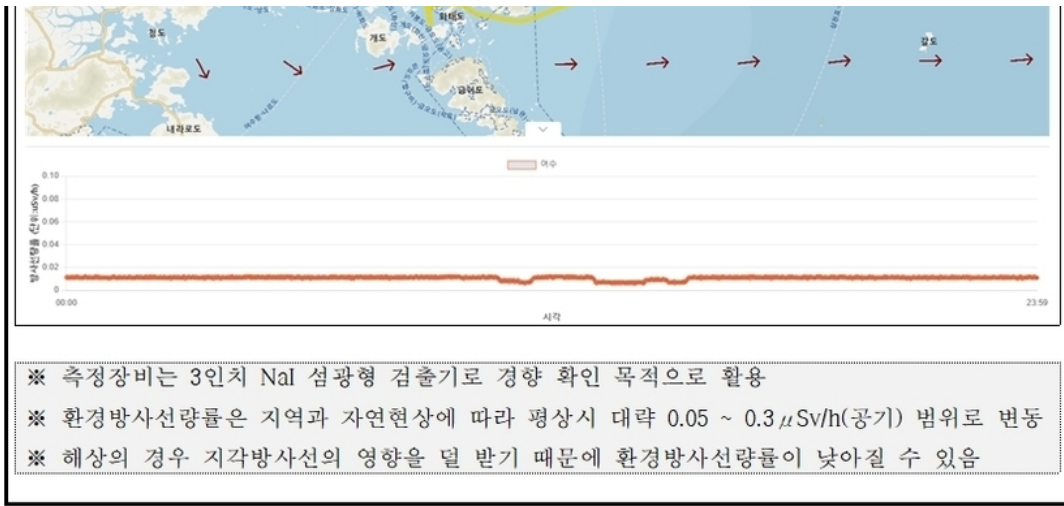
여수 해역 방사능 모니터링 보고서