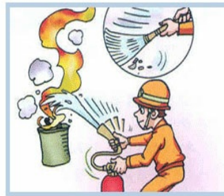
불길 주위에서부터 빗자루로 쓸듯이 골고루 방사한다.