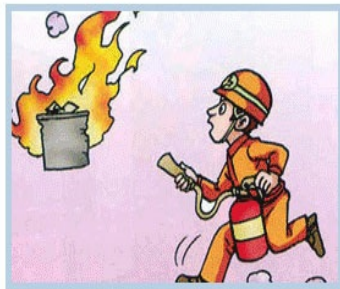
당황하지말고 침착하게 손잡이를 잡고 불쪽으로 접근한다.