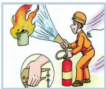
바람을 등지고 화점을 향하여 호스를 빼들고 손잡이를 움직인다