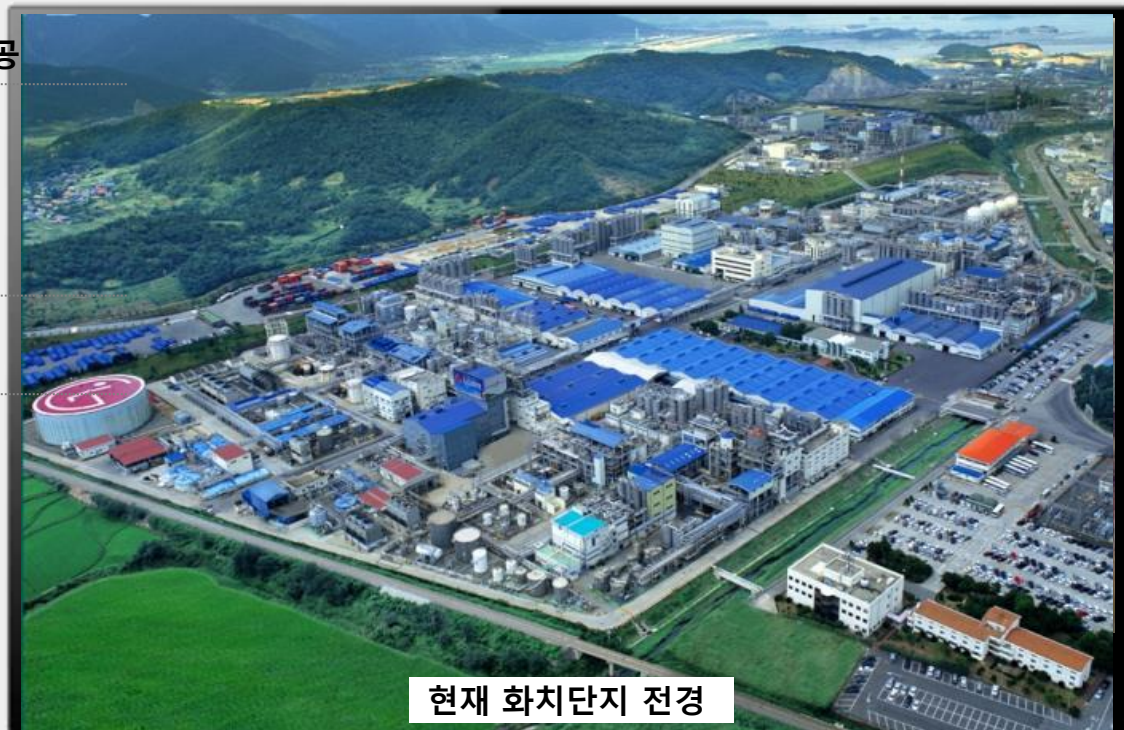
현재 화치단지 전경

2010. ABS 증설 2013. PVC공장 SL증설 2015. 녹색기업 지정, ABS 증설 2016. NBL 증설 2018. 통합폐수처리장 준공