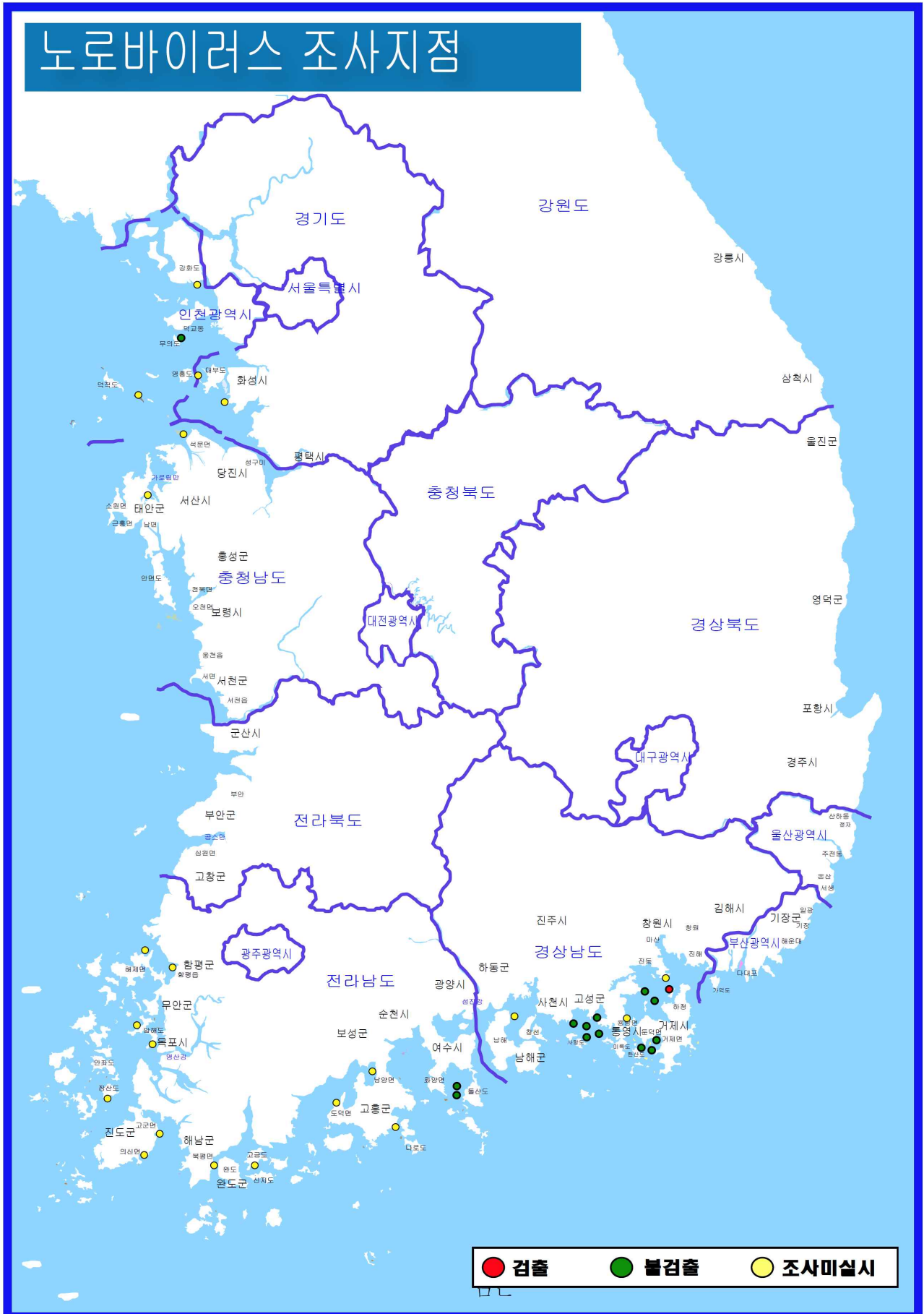
그림 1. 노로바이러스 발생상황도(전국 연안)