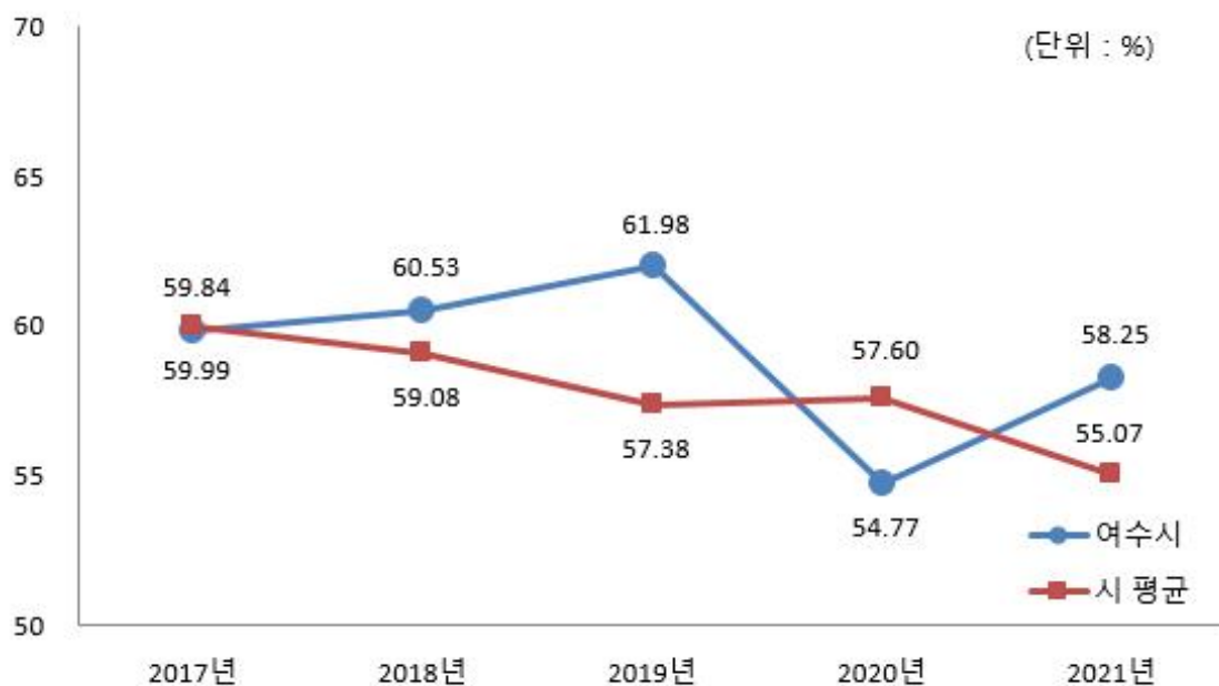
유사 지방자치단체와 재정자주도(당초예산) 비교

☞ 우리시의 2021년 당초예산 기준 재정자주도는 58.25%로 전년대비 3.48% 증가하였고, 유사 지방자치단체의 평균 재정자주도 55.07%보다 3.18% 높습니다. 이는 조정교부금의 증가와 지방교부세 및 국도비보조금 감소로 의존재원 비율이 감소하였기 때문입니다.