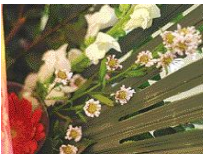
[시든 꽃 이용 재사용 화환]