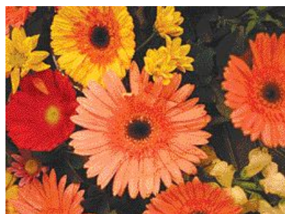
[상처 난 꽃 재사용]