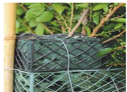
[구멍 난 오아시스 재사용]