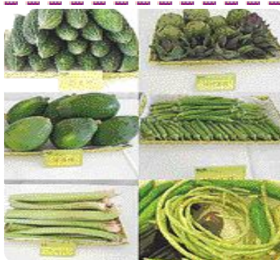
▲ 다양한 아열대 채소

에스닉 푸드(ethnic food) : 제3세계 나라들의 음식, 또는 동남아 음식