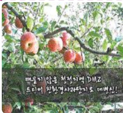
▲ DMZ 사과 단지

기후변화에 대응하기 위한 농업인들의 적극적인 도전이 가시화 될 것이다. 이에 대해, 농업인들은 작목을 전환하거나 생산지를 옮기는 등의 적극적인 대응을 할 것이며, 2모작 등으로 재배법을 바꾸는 경우도 나타날 것이다.