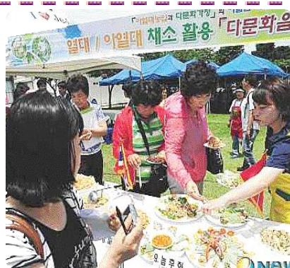
▲ 다문화 음식 행사