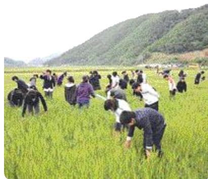
▲ 삼척의 청보리 축제