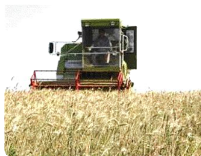
▲ 해남의 검정밀 2모작