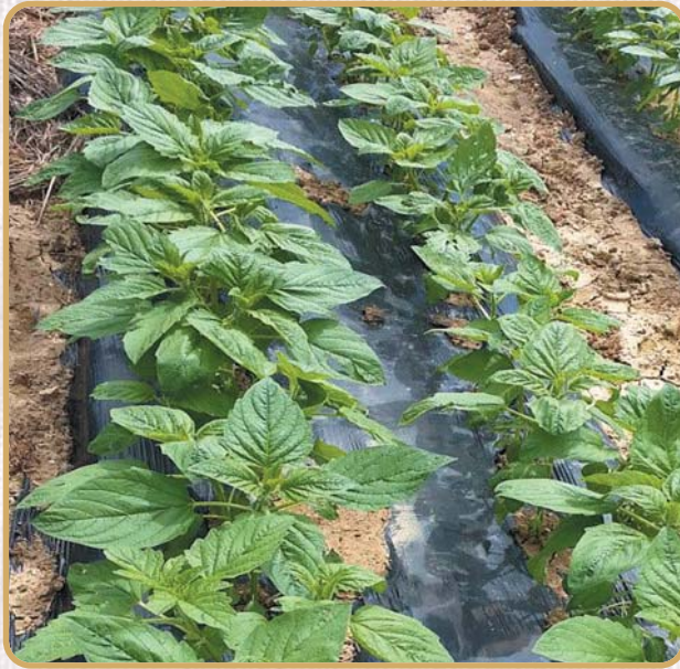
◀ 전용비닐 사용농가 포장 ▶