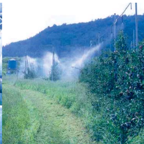
● 미세살수장치 가동