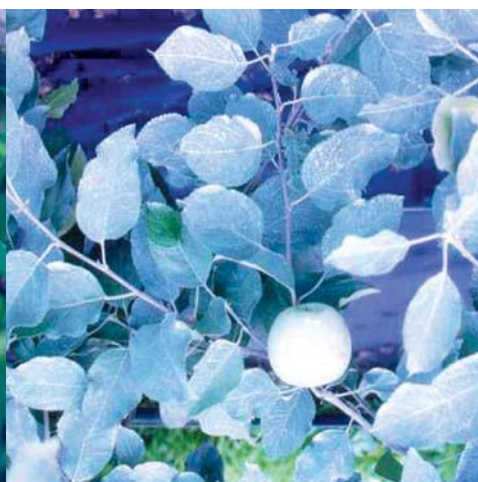
● 카울린 뿌리기