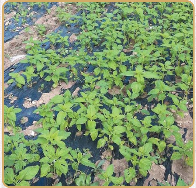
◀ 전용비닐 미사용농가 포장 ▶