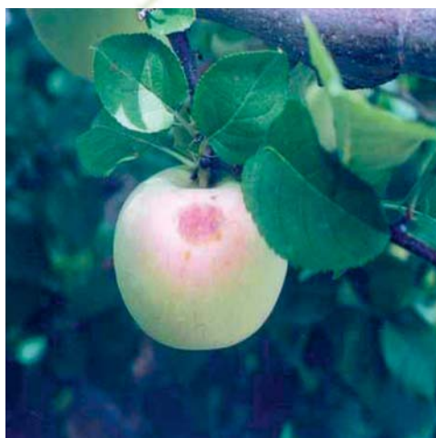
● 일 소 과