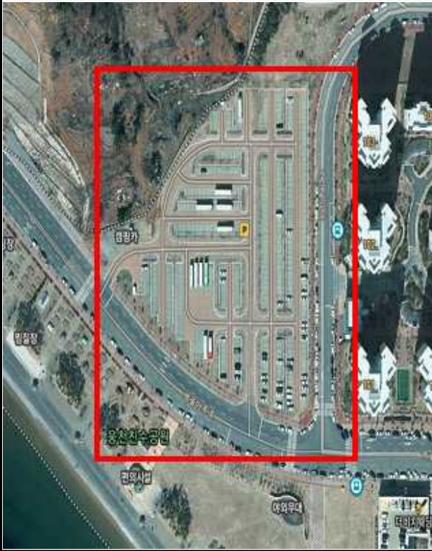
① 응천동1691번지 노외 주차장