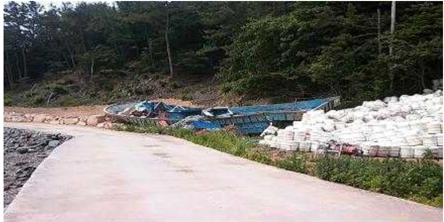
방 치 선 박 전 경 사 진

위 선체는 선체제작용 방치 몰드로서 공유수면의 효용을 저해할 뿐만 아니라, 수질을 오염시키고 있으므로 「공유수면 관리 및 매립에 관한 법률」 제6조 제3항 및 「같은 법 시행령」 제3조 제1항의 규정에 의거 위와 같이 직권으로 제거하고자 하니 이의가 있거나 문의사항이 있으신 분은 2017년 6월 16일까지 여수시 해양항만레저과로 연락하여 주시기 바라며, 위 기간 내에 이의신청이나 문의사항이 없을 경우에는 우리시에서 직권으로 제거함을 공고합니다.