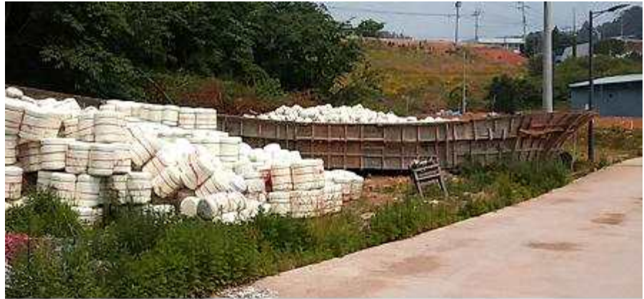
방 치 선 박 전 경 사 진

위 선체는 선체제작용 방치 몰드로서 공유수면의 효용을 저해할 뿐만 아니라, 수질을 오염시키고 있으므로 「공유수면 관리 및 매립에 관한 법률」 제6조 제3항 및 「같은 법 시행령」 제3조 제1항의 규정에 의거 위와 같이 직권으로 제거하고자 하니 이의가 있거나 문의사항이 있으신 분은 2017년 6월 16일까지 여수시 해양항만레저과로 연락하여 주시기 바라며, 위 기간 내에 이의신청이나 문의사항이 없을 경우에는 우리시에서 직권으로 제거함을 공고합니다.