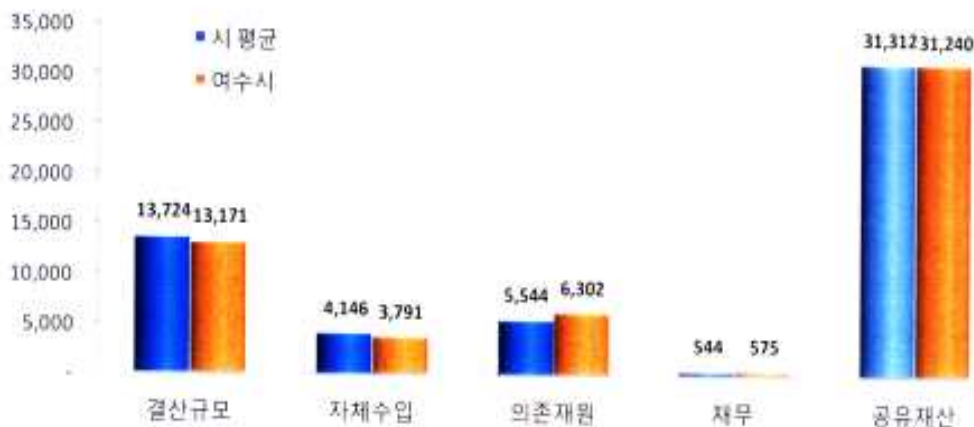
유사 지방자치단체 살림살이 규모비교 (단위: 억원)