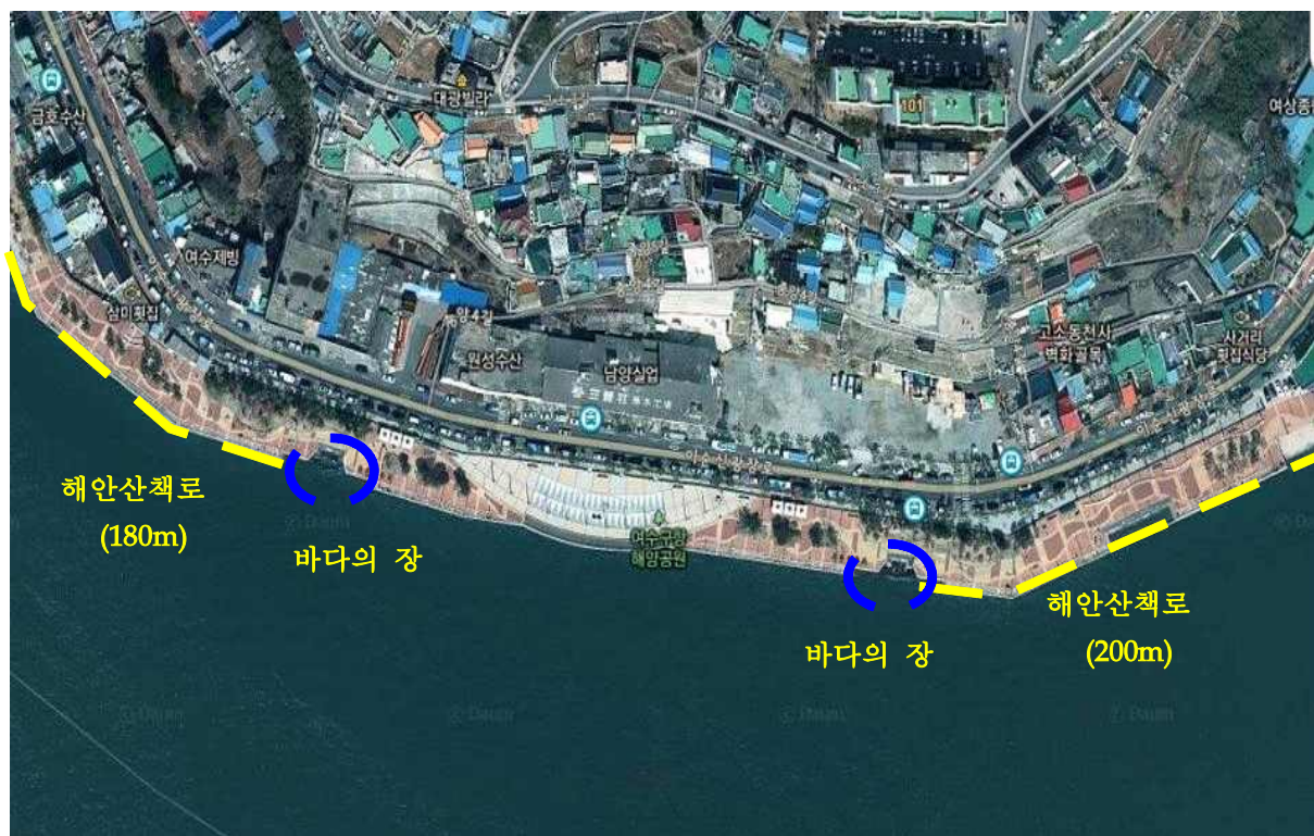
남시통제구역(일부구간) 통제시간 변경 도면 (종포 해양공원 일원)

○ 위치 : 종포 해양공원 일원 <전체(630m)중 일부적용(380m) >