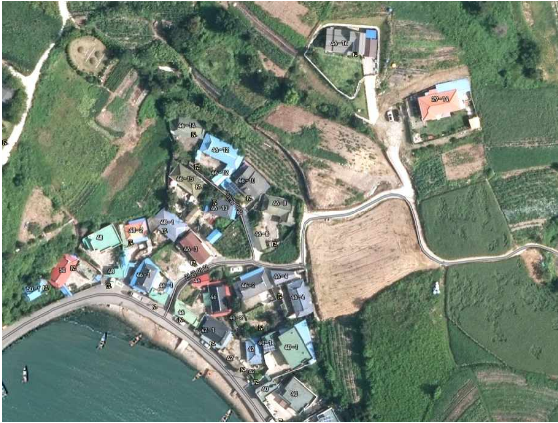
도로지정 면적 산출표(610-4번지)