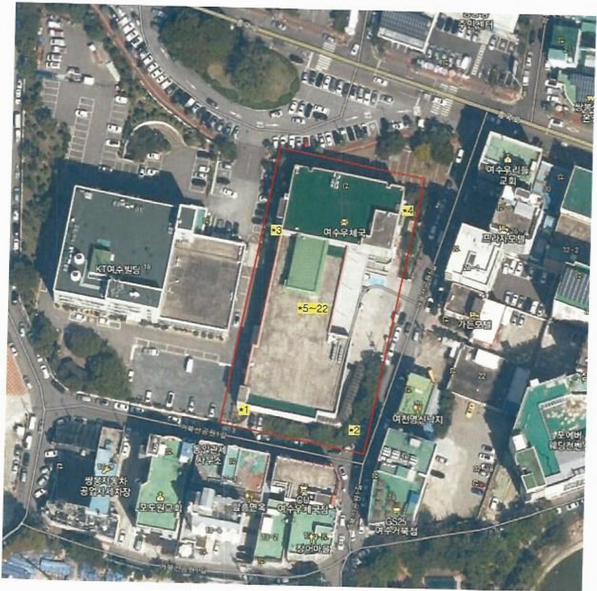
[별첨1] 측정 위치도(측정 장소)