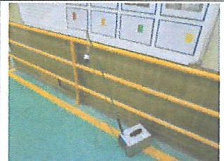
#8 작업장 주변 (실내)