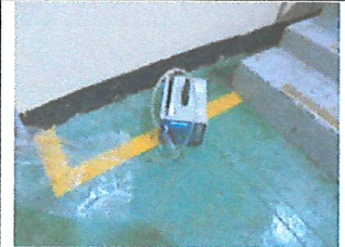
#44 음압기 배출구