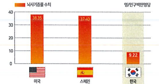
[세계장기이식 및 기증 통계, 2020]

다른 국가들과 비교해보도 차이가 있는데, 미국과 스페인의 뇌사 기증(명/인구백만명당)은 각각 38.35명, 37.40명으로 9.22명인 우리나라와 큰 차이가 납니다.