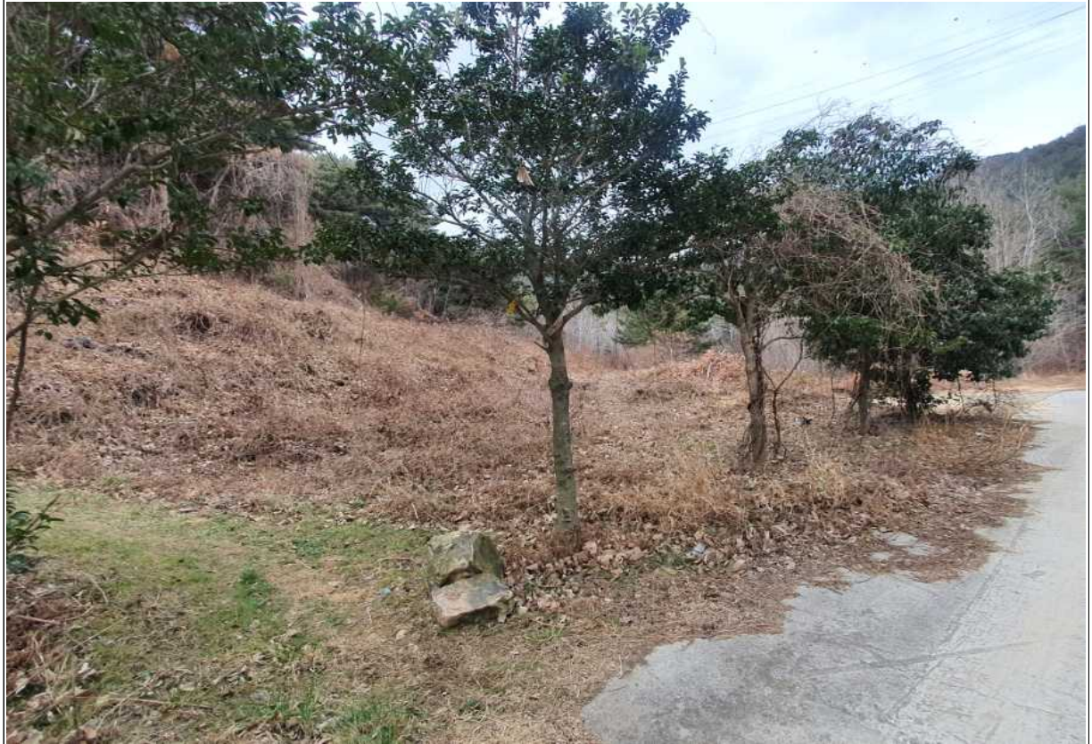
토지소재지 | 전라남도 여수시 중흥동 622(전), 면적 120㎡, 맹지