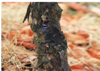
포도줄기 꽃매미 피해