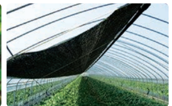
고온기 차광망 설치(내부)