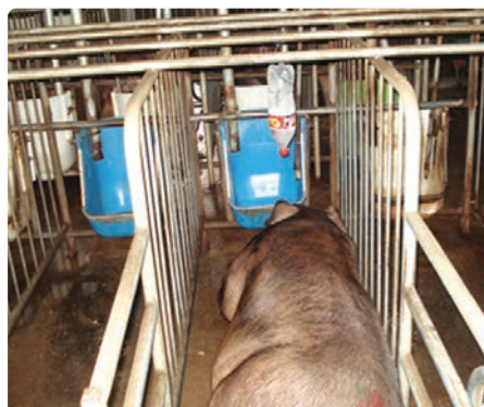
열린 페트병을 활용 점적관수