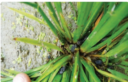
벼 포기 속 아랫부분에서 생활 (밀식재배시 방제효과 ↓)