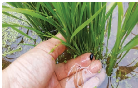
소리에 민감하여 방제시 물속으로 숨음(논물 빼고 방제)