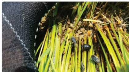
6월에는 모판으로 먼저 이동함