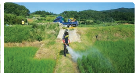
발생 많은 논은 개별방제 실시

■ 2차 방제 - 1차 방제 후 밀도가 높은 단지(어린 약충 시기, 7월 하순까지)