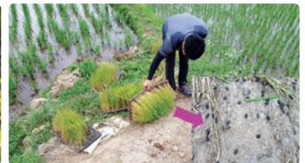
수시로 모판을 털어 죽임

■ 방제약제 논두렁 살포 : 5월 하순~6월 중순 논두렁 방제 (3~5배 고농도 살포)