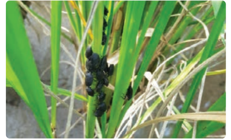
출수 전 피해 (벼 잎, 줄기 흡즙 → 새끼치기 억제, 줄기 고사)