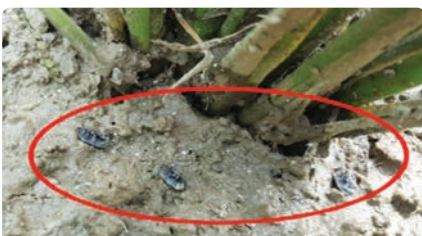
논물을 완전히 빼지 않으면 방제효과가 크게 떨어짐