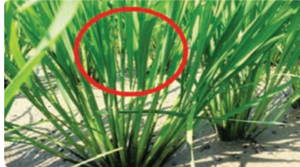
적정본수 모내기(방제효과 ↑)