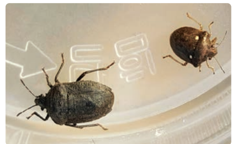
(왼 쪽) 먹노린재 성충 (오른쪽) 먹노린재 약충