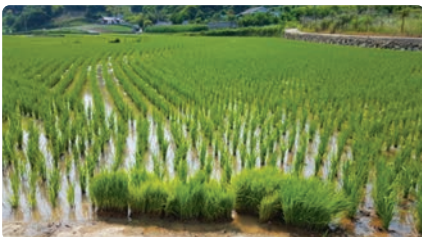
모내기 후 남은 모판 설치

남은 모판을 세수대야 등 통에 털어 먹노린재를 포획한 후 밭아 죽임(공동방제 전까지 3~4회 실시)