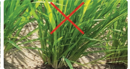
과다본수 모내기(방제효과 ↓)