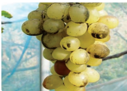
포도 과실 꽃매미 피해(그을음 증상)