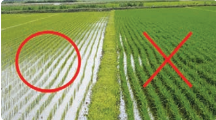
모내기를 빨리한 논으로 먼저 이동