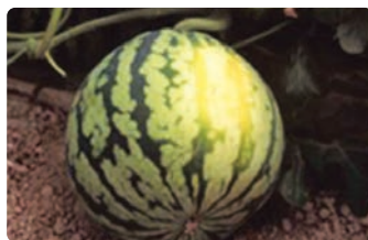
강한 햇빛에 의한 수박 일소과