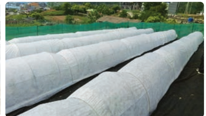
부직포 막덮기 터널재배