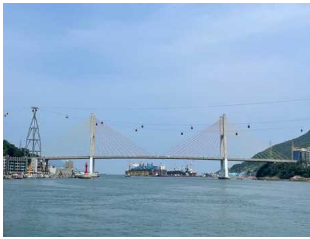
▶ 거북선대교 전경(돌산읍 방향)