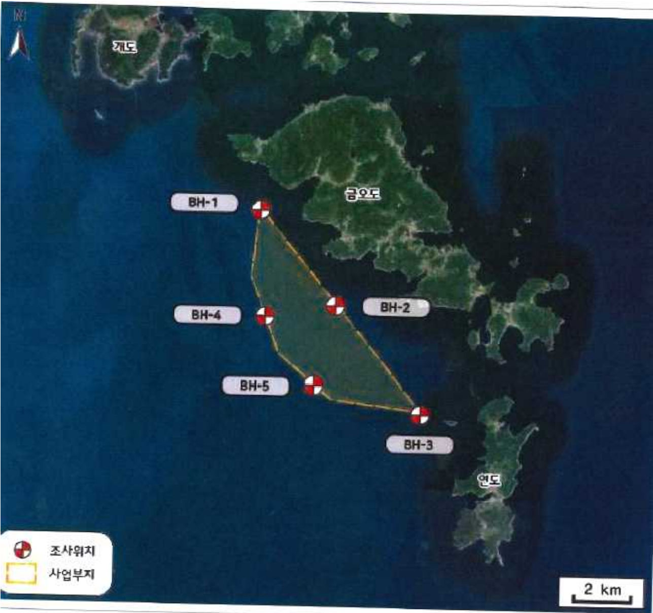
붙임 1 위치도 및 좌표