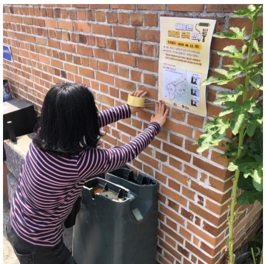
5/7 해비타트 도색공사 홍보