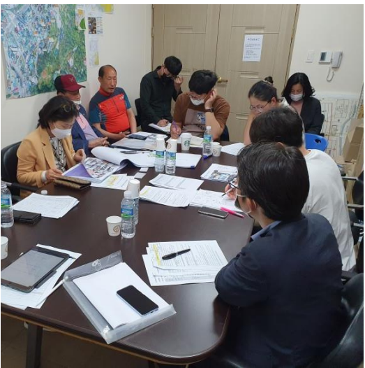
5/14 제16차 주민회의 지원