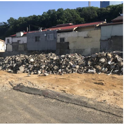
5/14 문수지구 현장지원