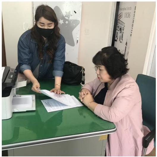
5/13 주민 민원문제 해결