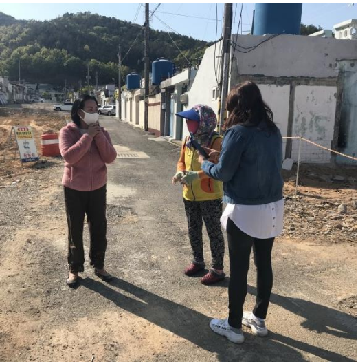
4/28 공동이용시설 내용 안내

누구나 한 번은 들어본 이야기 도시재생 , 그럼 도시재생관련 정보는 어디서 가장 많이 접할 수 있을까요? “ 도시재생종합정보체계 ”를 소개합니다!