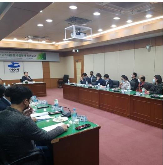
5/4 종화지구 마스터플랜 보고회