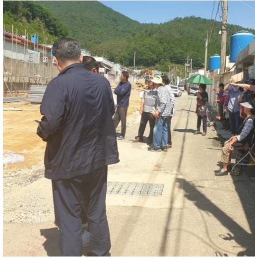
6/2 철거 후 주민 민원사항 확인