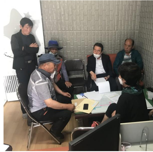
5/27 문수지구 도시가스배관 입찰