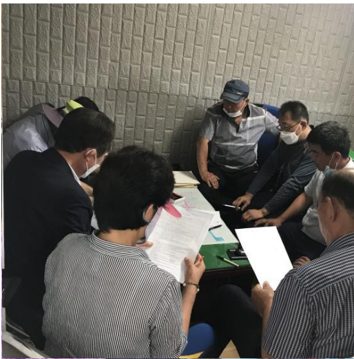
6/10 문수 도시가스 도급계약 회의