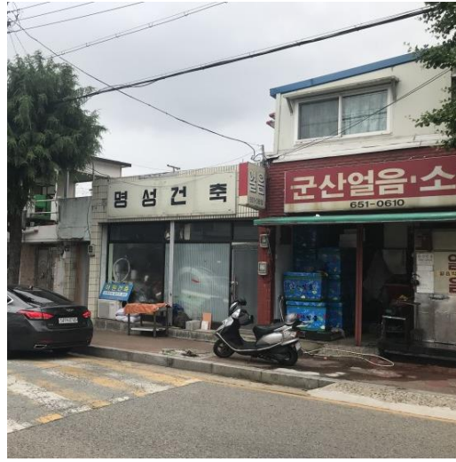
6/3 문수지구 간판개선사업 현황조사