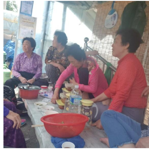
5/28 종화지구 주민과의 대화