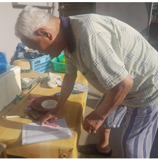
6/4 종화지구 새들마을사업 동의서