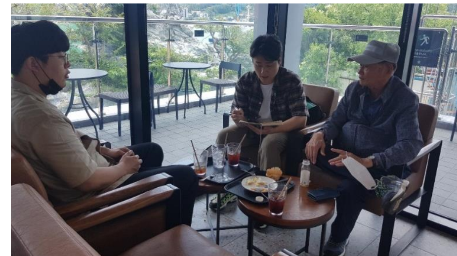
7/7 종화지구 주민과 마을역사자원 기록화