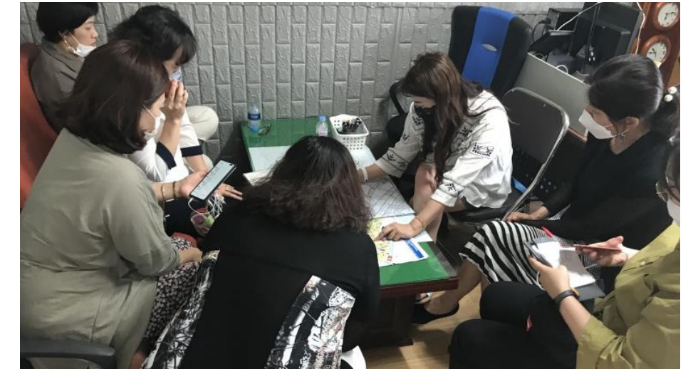
7/7 문수지구 여수시 도시재생대학 맵핑 작업 참여