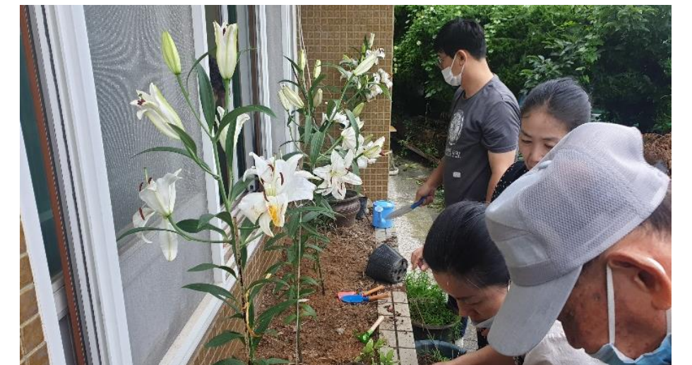
7/2 종화지구 임시사랑방 정원사교육 지원