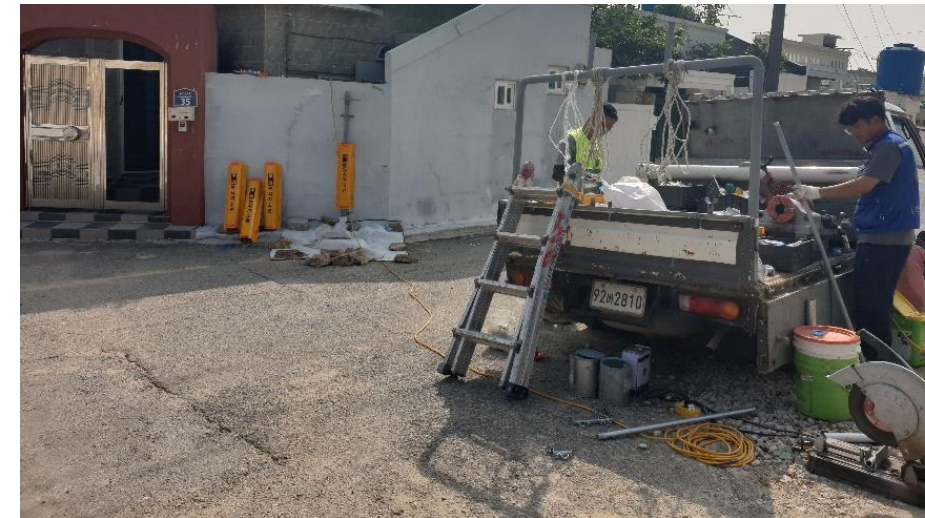
7/8 문수지구 도시가스 배관공사 지원