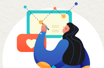
도시재생 자료수집 및 조사