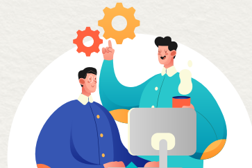
도시재생 사업계획 수립 지원