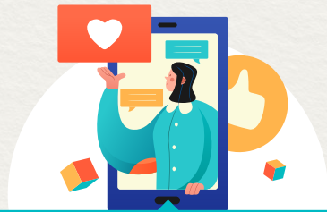
도시재생사업 홍보기획 및 수행