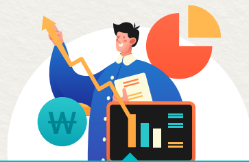
주민협의체 활동 지원