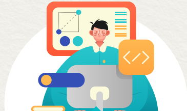
도시재생대학 교육운영 지원