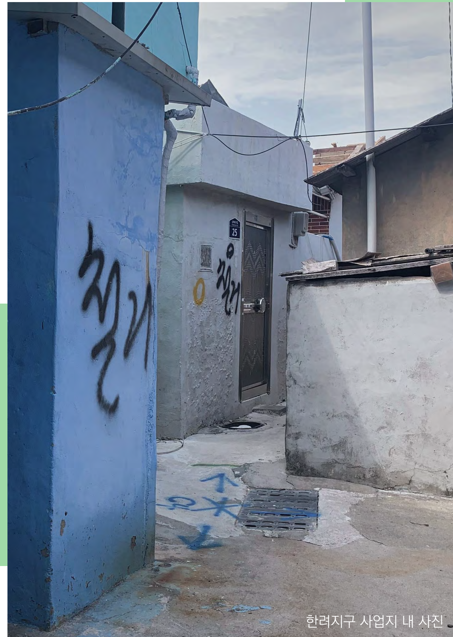
한려지구 사업지 내 사진