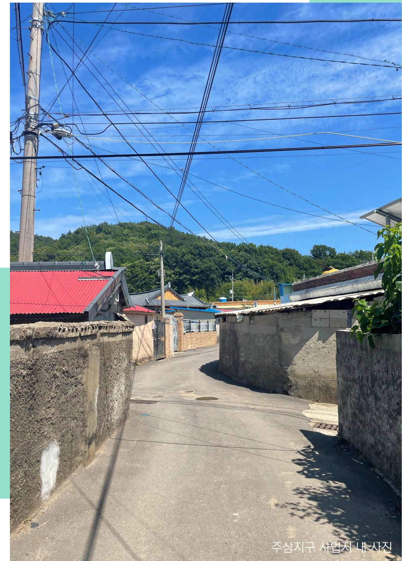
주삼지구 사업지 내 사진