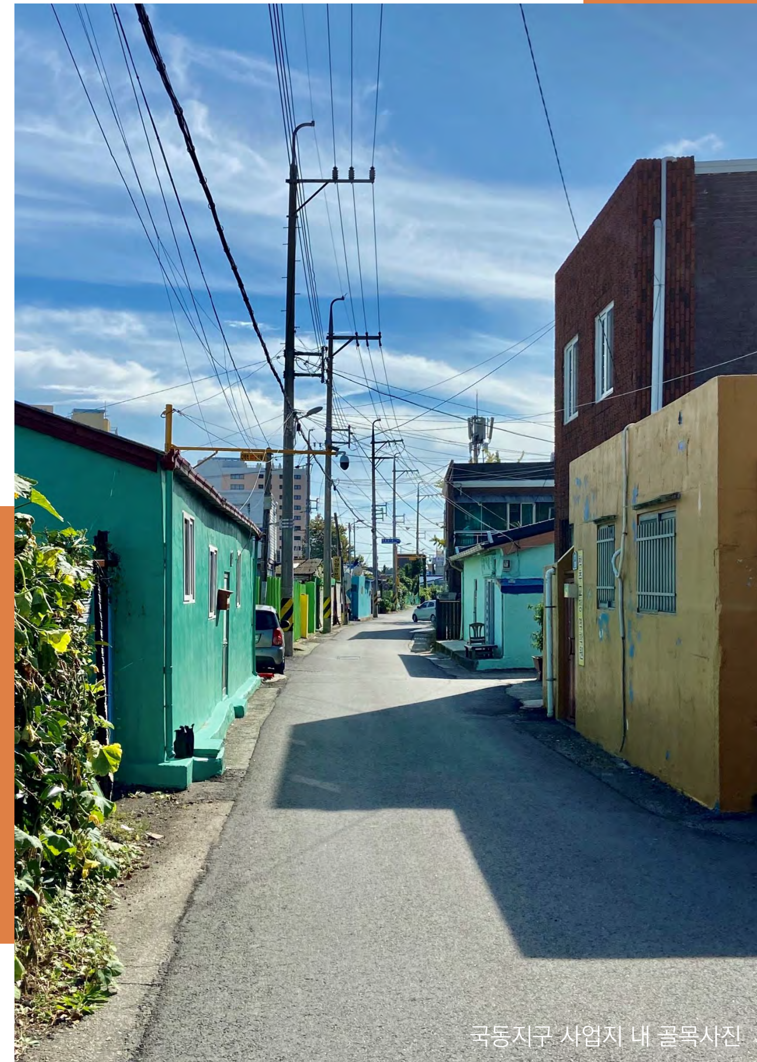
국동지구 사업지 내 골목사진