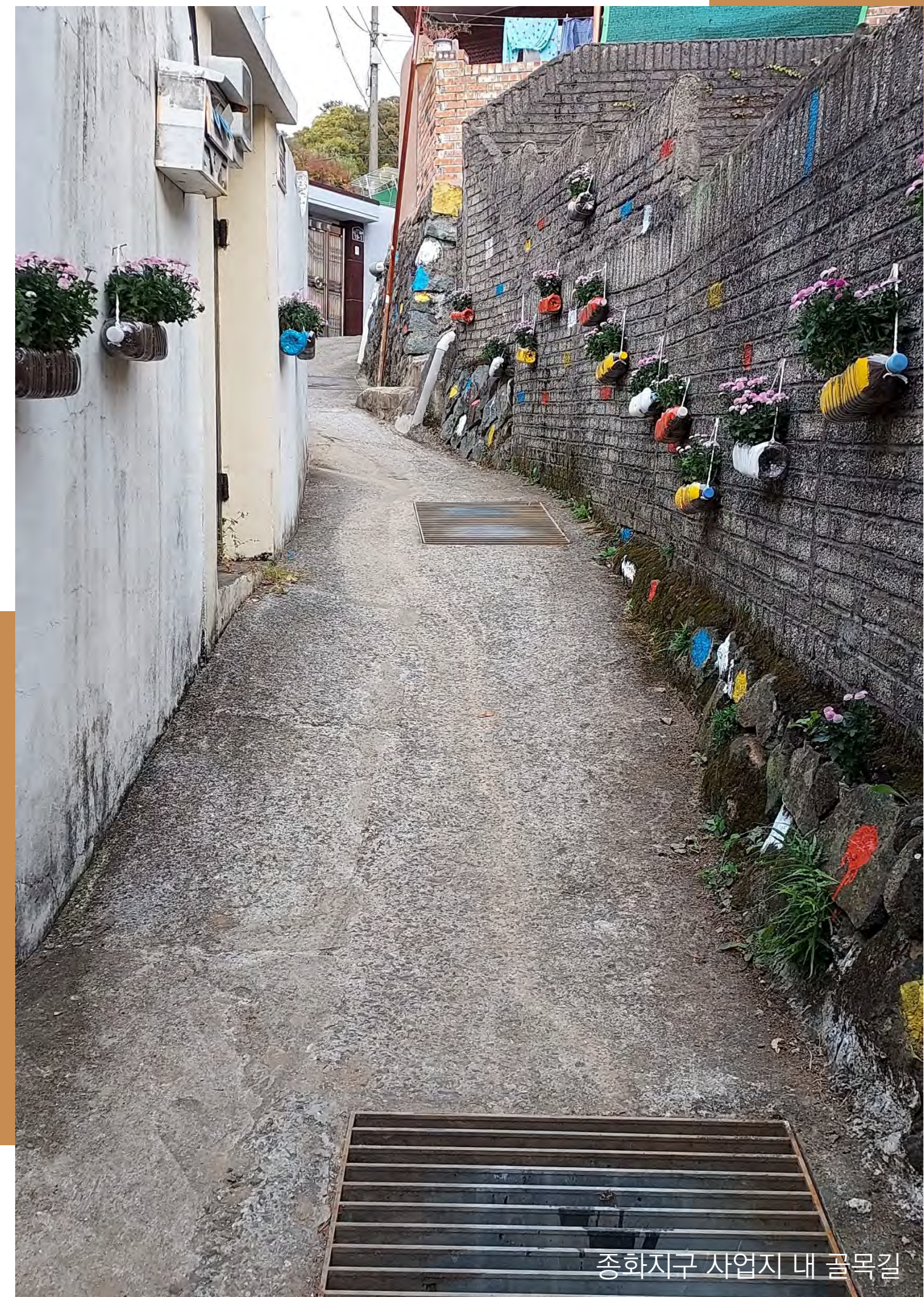
종화지구 사업지 내 골목길