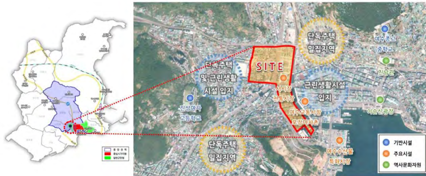
* 남산동 남산마을 대상지 위치도 - 전남 여수시 서교동 500 일원 (116,000㎡)

지난 3월, 전라남도에서 주관한 '2022년도 전남형 소규모 도시재생사업' 공모 결과 여수시 남산동 남산마을이 선정되었습니다. 전남형 소규모 재생사업은 전라남도가 올해 지방자치단체를 대상으로 공모한 도시재생 뉴딜사업의 마중물 성격의 사업입니다. 또한 도시재생 예비사업 유사사업으로 국토교통부로부터 인정받아 사업 완료 시 광역 공모가 가능한 사업입니다. 해당 사업은 '도시재생 활성화 및 지원에 관한 특별법'에 근거하여 도시재생 활성화지역 지정 여건을 갖추고 쇠퇴 조건을 만족하는 지역에 주민화합과 활동거점공간을 조성함으로써 주민이 제안한 사업내용을 바탕으로 주민 다수가 편익을 누리고 공공의 이익을 추구할 수 있는 사업계획을 수립하여 주민역량강화를 하고 지역 거버넌스를 구축하는 소규모 단위사업을 지원하는 사업입니다.