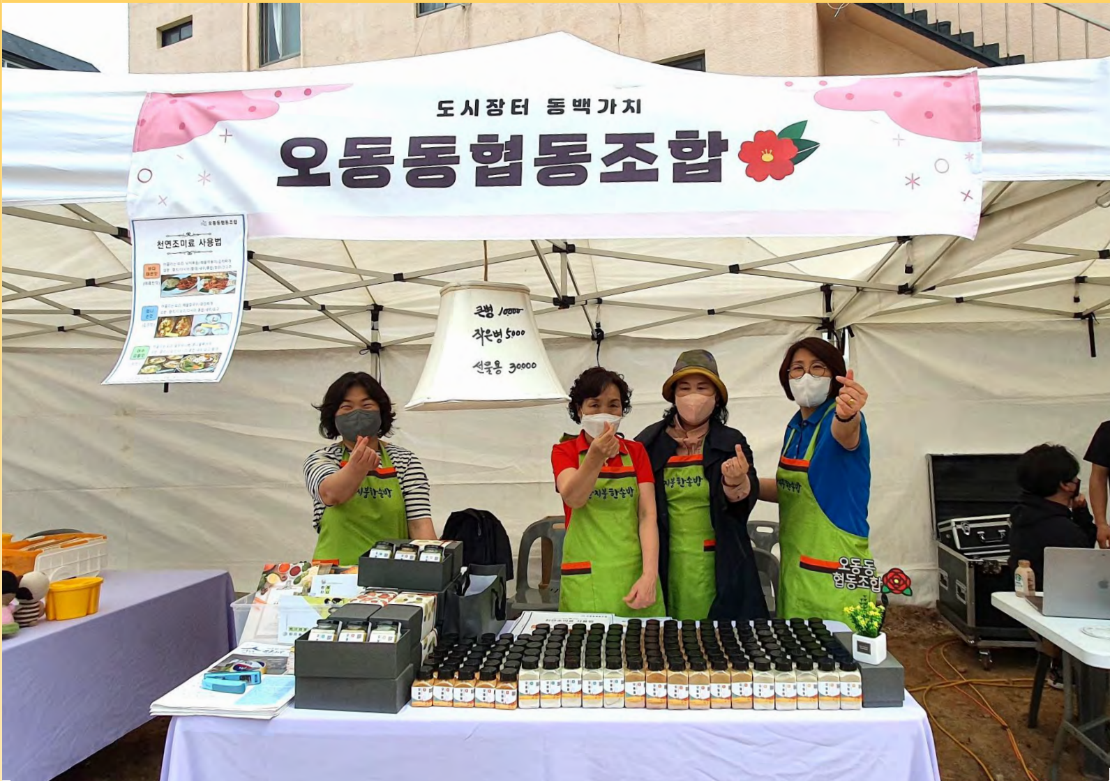
* 오동동협동조합 도시장터 동백가치 프리마켓 참여