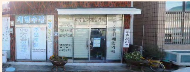
* 마음치료약국 대상지 (여수시 남산북9길 28)

남산동에서 추진하는 소규모 재생사업은 지역 청년과 주민이 함께 하는 세대융합형 공간환경정비로 노후저층주거지역 활성화의 마중물 역할을 하고 대상지역 뿐만 아니라 남산동 지역 공동체를 복원하며 지역 내 다양한 민간단체들 간의 거버넌스와 파트너십 구축을 통해 협동과 신뢰의 사회적 자본이 강화될 것으로 기대됩니다.