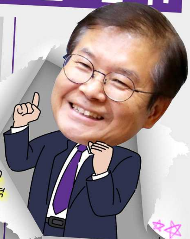
이정식 고용노동부 장관