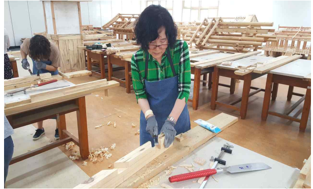
<한옥 결구법 실습>