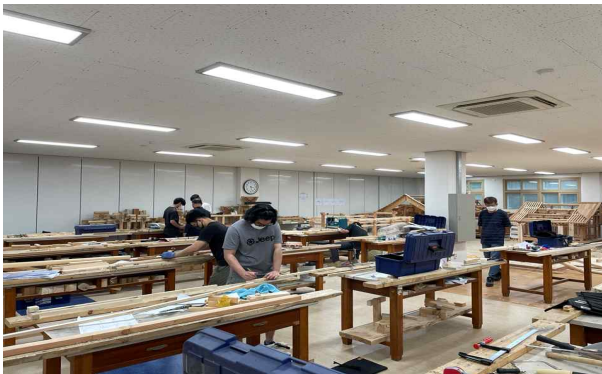
<한옥 모형 실습>