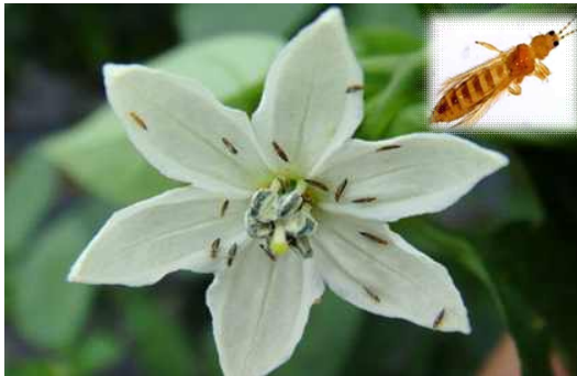
< 총채벌레 >