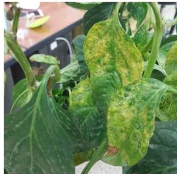
< 총채벌레 피해 잎(바이러스) 및 과실 >