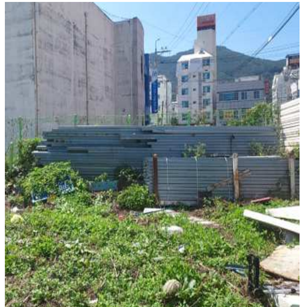
적치물 위치도 및 현장사진

위 장애물(적치물)은 어항의 효율적 이용을 저해하고 있으나 소유자가 불분명하여 어촌 · 어항법 제46조 및 같은법 시행령 제41조제1항에 따라 위와 같이 직권으로 제거하고자 하오니 이의가 있거나 문의사항이 있으신 분은 2023년 9월 4일까지 여수시 섬발전지원과(061-659-3991)로 연락하여 주시기 바랍니다.