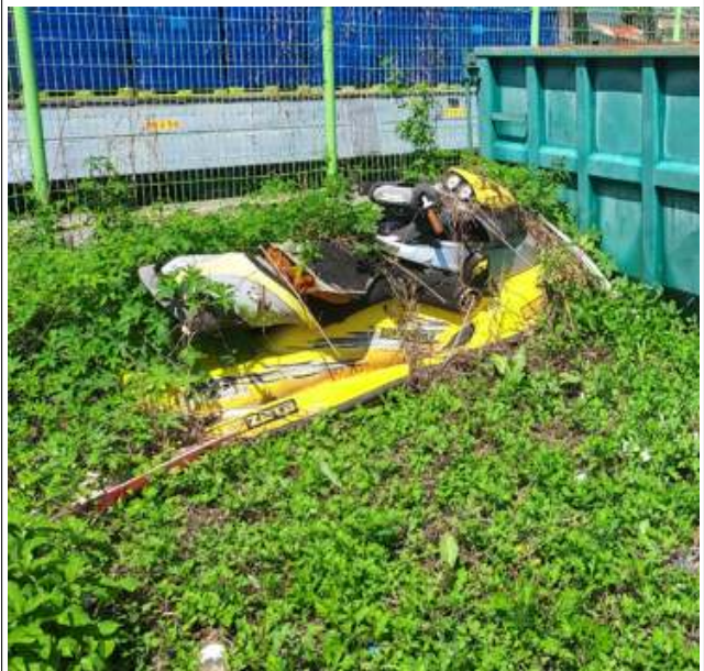
적치물 위치도 및 현장사진

위 장애물(적치물)은 어항의 효율적 이용을 저해하고 있으나 소유자가 불분명하여 어촌 · 어항법 제46조 및 같은법 시행령 제41조제1항에 따라 위와 같이 직권으로 제거하고자 하오니 이의가 있거나 문의사항이 있으신 분은 2023년 9월 4일까지 여수시 섬발전지원과(061-659-3991)로 연락하여 주시기 바랍니다.