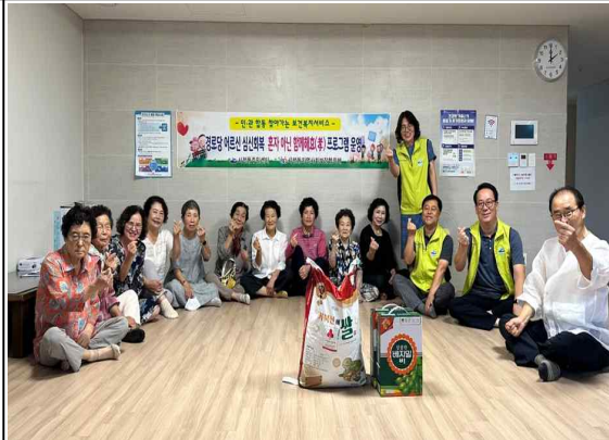
현장행정, 응천동 벤치 교체, 으뜸마을 나무 심기, 찾아가는 경로당 프로그램