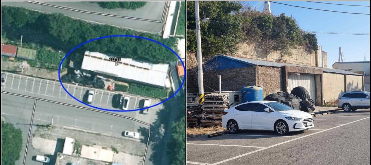
적치물 위치도 및 현장사진

위 장애물(적치물)은 어항의 효율적 이용을 저해하고 있으나 소유자가 불분명하여 어촌·어항법 제46조 및 같은법 시행령 제41조 제1항에 따라 위와 같이 직권으로 제거하고자 하오니 이의가 있거나 문의 사항이 있으신 분은 2024년 1월 21일까지 여수시 섬발전지원과(☎061-659-3979)로 연락하여 주시기 바랍니다.