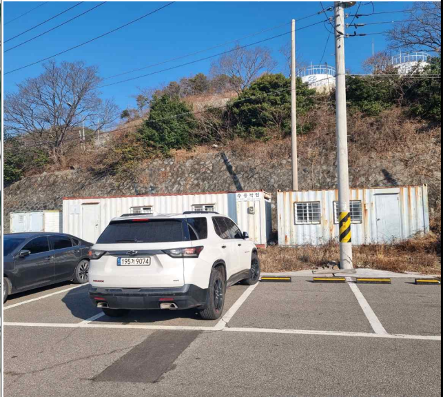
적치물 위치도 및 현장사진

위 장애물(적치물)은 어항의 효율적 이용을 저해하고 있으나 소유자가 불분명하여 어촌 · 어항법 제46조 및 같은법 시행령 제41조 제1항에 따라 위와 같이 직권으로 제거하고자 하오니 이의가 있거나 문의 사항이 있으신 분은 2024년 1월 21일까지 여수시 섬발전지원과(☎061-659-3979)로 연락하여 주시기 바랍니다.