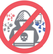
사이버 공간 내 성적 괴롭힘