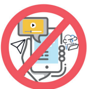
가족, 지인에게 유포하겠다는 협박