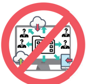
불법사이트 유통 또는 공유