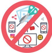
허위영상을 제작과 유포