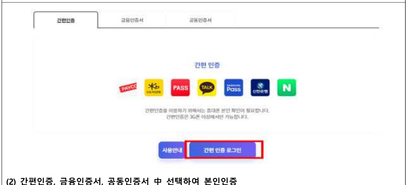
(2) 간편인증, 금융인증서, 공동인증서 中 선택하여 본인인증