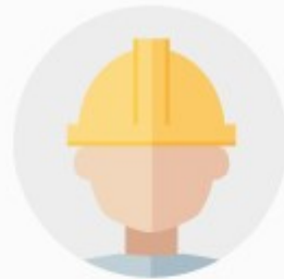
사고대비물질 취급자 (지정수량 이상)