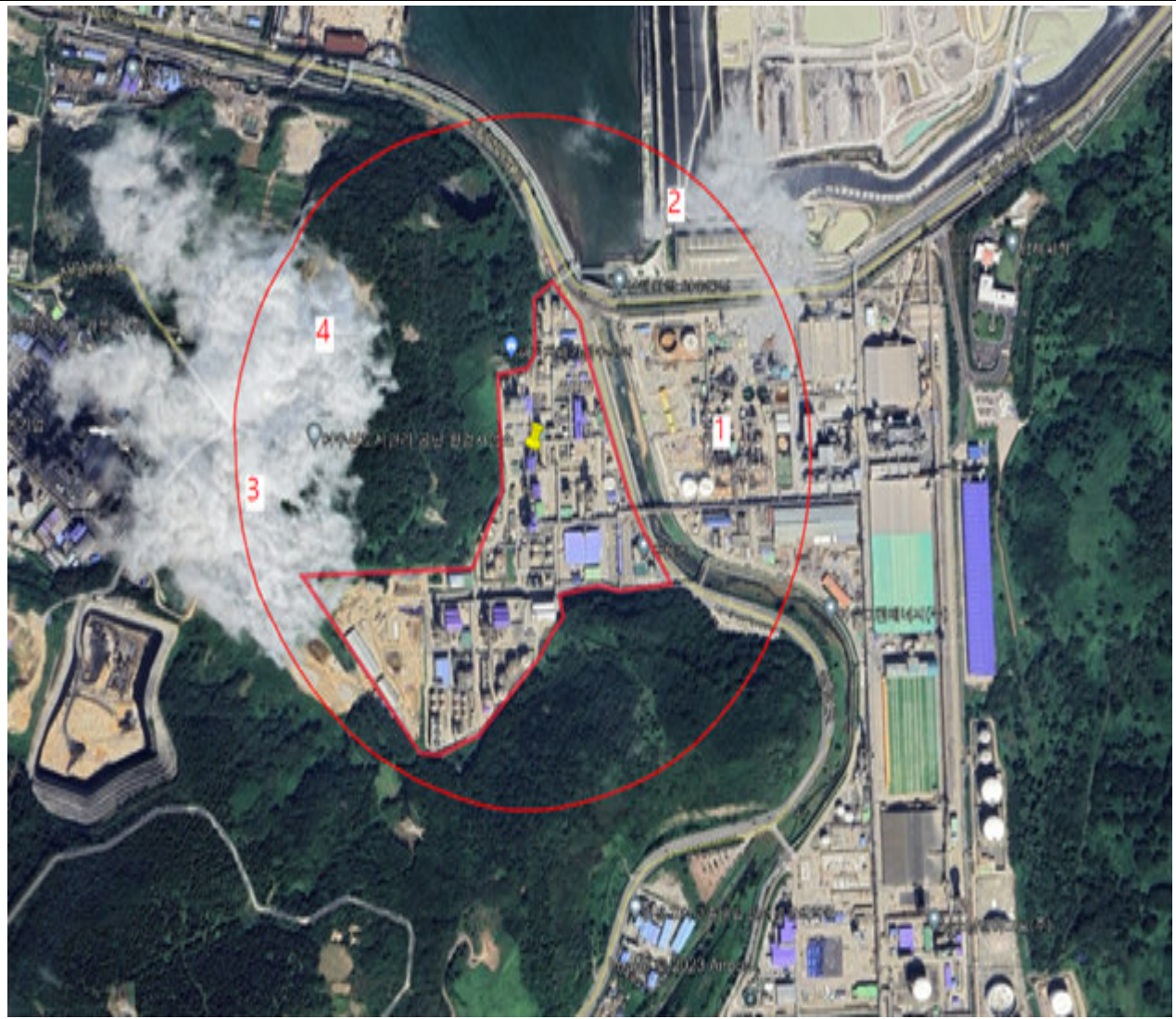
최대 영향범위 기준 반경 500m 내 환경 정보 위치도