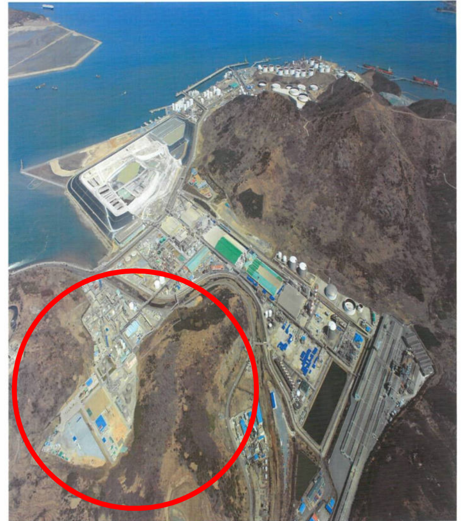
< TKG휴켄스 여수공장 전경 >