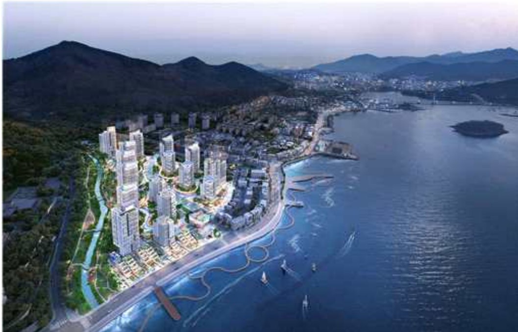
입 상 작(1위) -