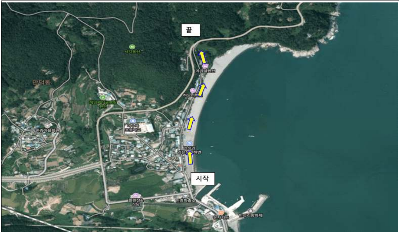
만성리 해수욕장 개장기간 임시 일방통행 구간