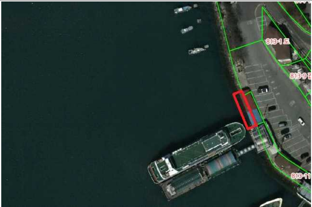
공유수면 점용·사용 구적도