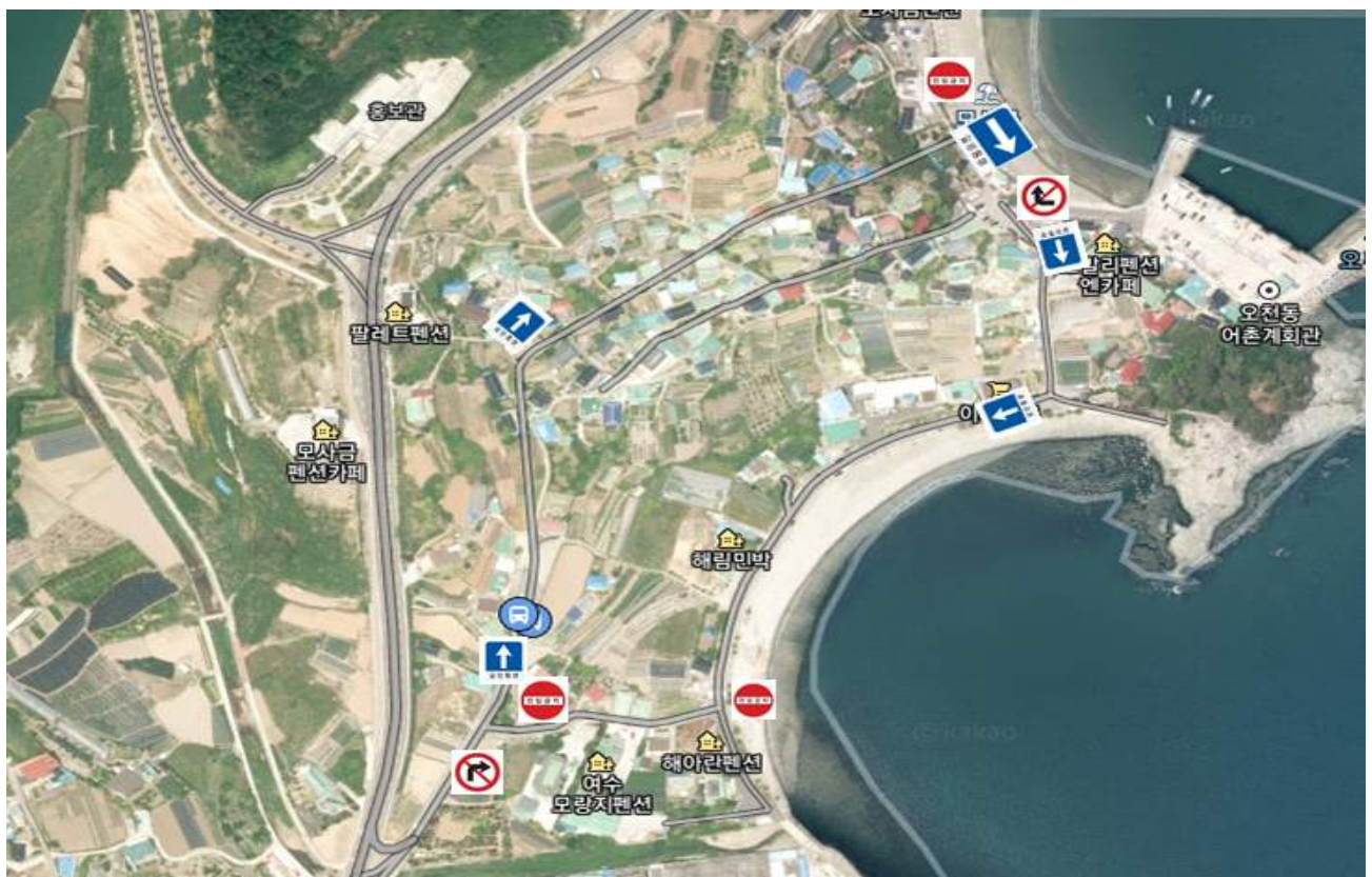
모사금 해수욕장 개장기간 임시 일방통행 구간